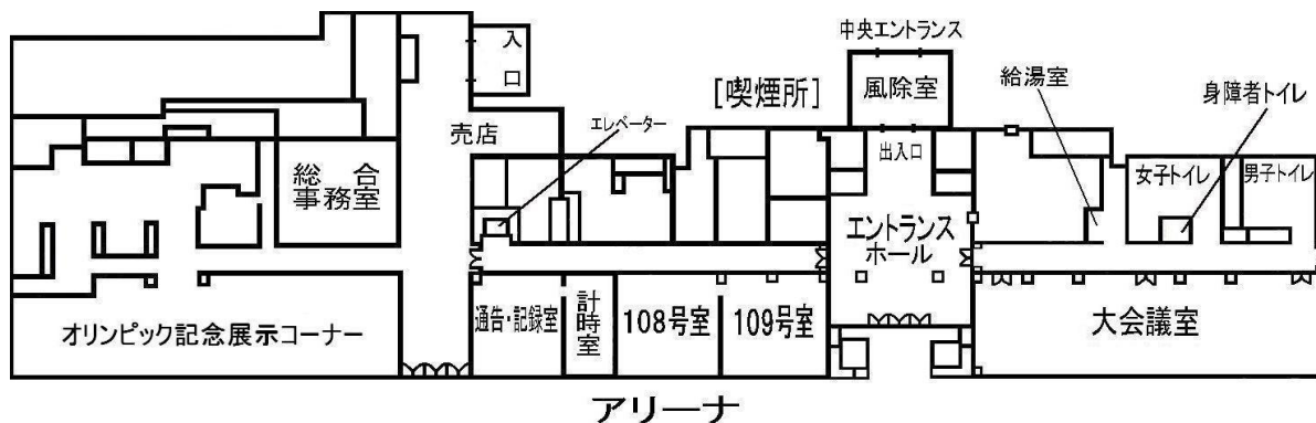
【1階北側部分平面図】